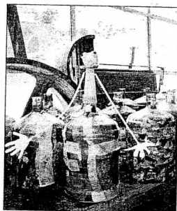
Les lumières flottantes réalisées par les enfants en atelier.

► De 14 h à 18 h. - Sur quatre heures, un florilège d'ateliers sera proposé par les différentes associations, destinés aux petits et grands. Des lectures, des contes, du théâtre, des expositions et une sensibilisation sur le développement durable, qui permettra d'évoquer le futur éco-quartier de la ville à travers un spectacle de rue. Un peu d'histoire avec la création d'une fresque retraçant l'histoire de la ville par le graffiti. Et aussi un atelier cirque, création de bois et d'embarcations nautiques, initiation à la pêche et découverte de la flore du canal... ► 19 h, la soirée commence. - Le