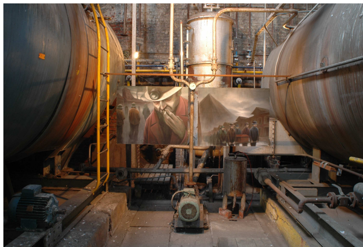
Vue de la chaufferie – Usine Cavois-Mahieu

Le site a été entièrement requalifié par la « SEM ville renouvelée » en « hôtel d'entreprises », regroupant des activités diverses. Il conserve néanmoins de multiples éléments patrimoniaux remarquables : les deux cheminées voisines, la chaufferie, des ateliers, bureaux, qui en font un fleuron de la mémoire collective roubaisienne.